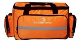
İLK YARDIM ACİL MÜDAHALE

Sanal zorbalığı bir yetişkine bildirmeme sebepleri sorulduğunda ergenler; arkadaşlarının daha iyi internet kullanıcısı olduğunu, onları daha yakın ve önemli bulduklarını, okuldaki yetişkinlerin sanal zorbalığı durdurabilecek herhangi bir şey yapamayacağına inandıklarını ve anne babalarının interneti yasaklamasından korktuklarını bildirmişlerdir.